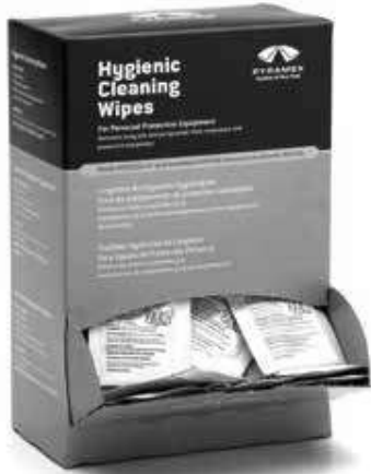
HCW100 100 Individually Packaged 5" x 8" Alcohol Free Hygienic Wipes | 100 Lingettes Hygiéniques Sans Alcool de 5" x 8" Emballées Individuellement