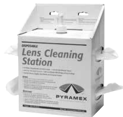
LCS20 16 oz. Lens Cleaning Station with 1,200 Tissues | 16 onces. Station de Nettoyage de Lentilles avec 1 200 Mouchoirs