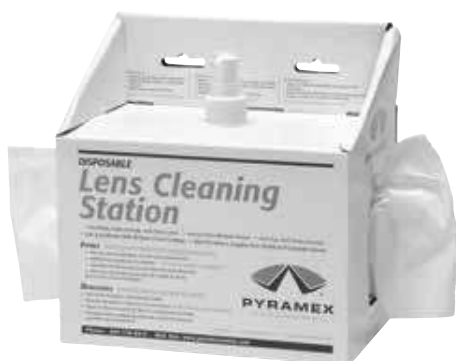
LCS10 8 oz. Lens Cleaning Station with 600 Tissues | 8 onces. Station de Nettoyage de Lentilles avec 600 Mouchoirs