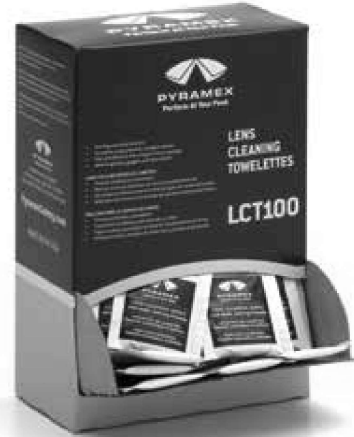
LCT100C 100 Individually Packaged 5" x 8" Cleaning Towelettes | 100 Emballés Individuellement 5" x 8" Lingettes de Nettoyage

i Safe and effective for cleaning respirators, hard hat suspensions and other personal protective equipment, but not to be used on disposable particulate respirators. | Sûr et efficace pour nettoyer les respirateurs, les suspensions de casques de sécurité et autres équipements de protection individuelle, mais ne doit pas être utilisé sur les respirateurs jetables contre les particules.